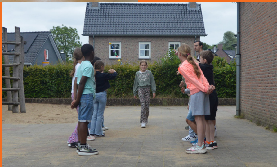
Kanjer oefening "Stalen gezichten"