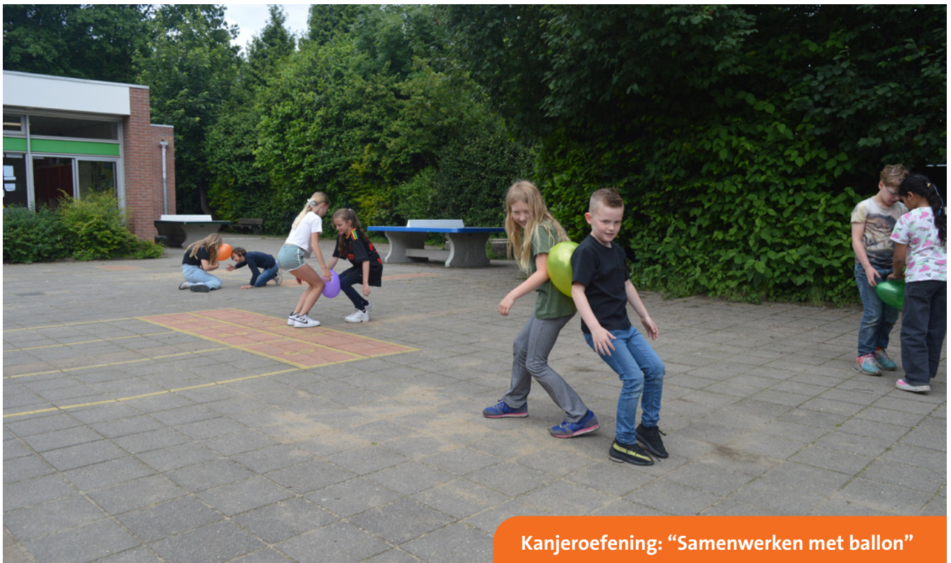
Kanjer oefening: "Samenwerken met ballon"