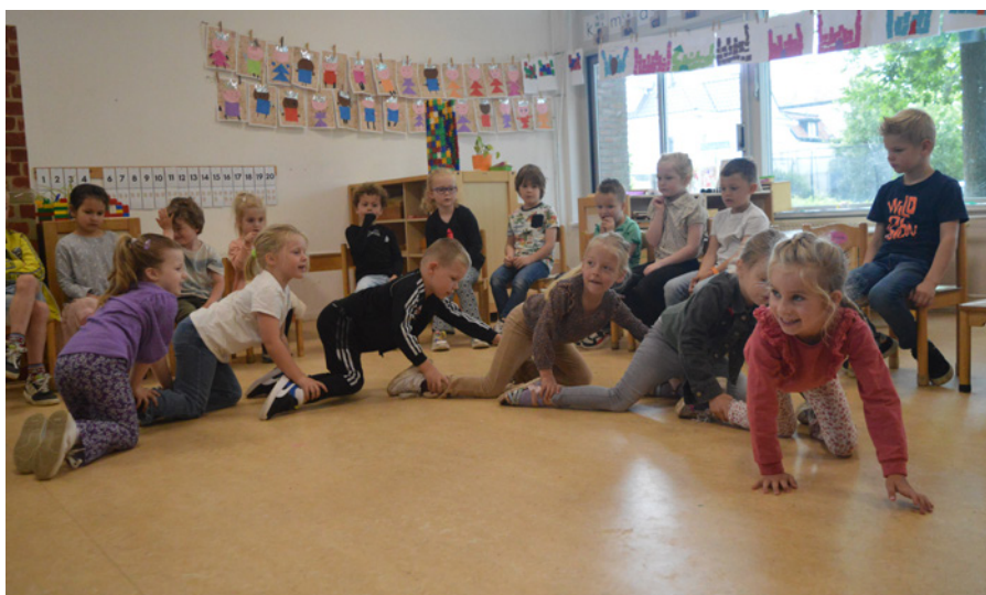
Kanjer oefening "De kruipende rups"

U kunt op school batterijen inleveren. Dit is goed voor het milieubewustzijn van de kinderen. Met de opbrengst kunnen wij voor waardevolle producten sparen, bijvoorbeeld computers, muzikadozen, jongleerballen enz.