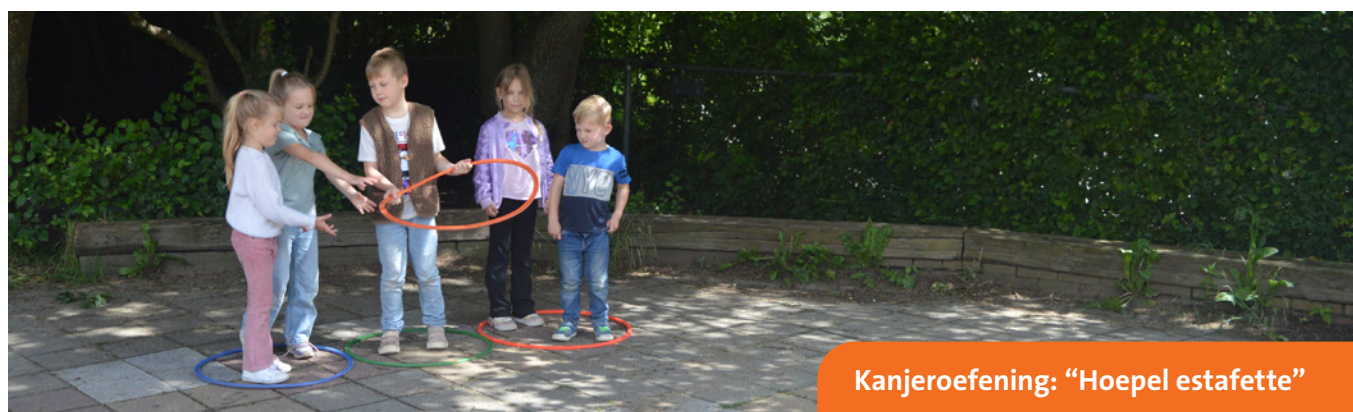
Kanjeroefening: "Hoepel estafette"

Bij aanmelding is een toestemmingsverklaring opgenomen m.b.t. het gebruik maken van foto- en filmmateriaal waarop uw kind staat voor website, schoolgids, facebook enz.